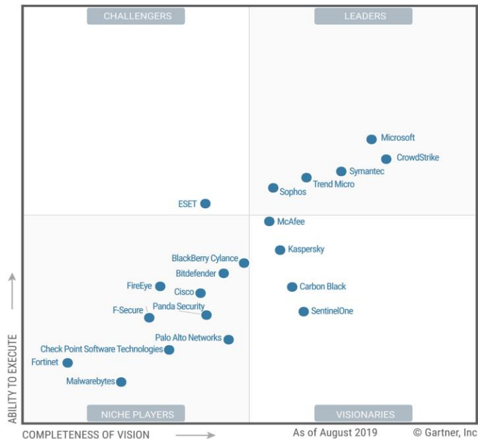
Figure 1. Magic Quadrant for Endpoint Protection Platforms

Gartner Magic Quadrant for Endpoint Protection Platforms, August 2019